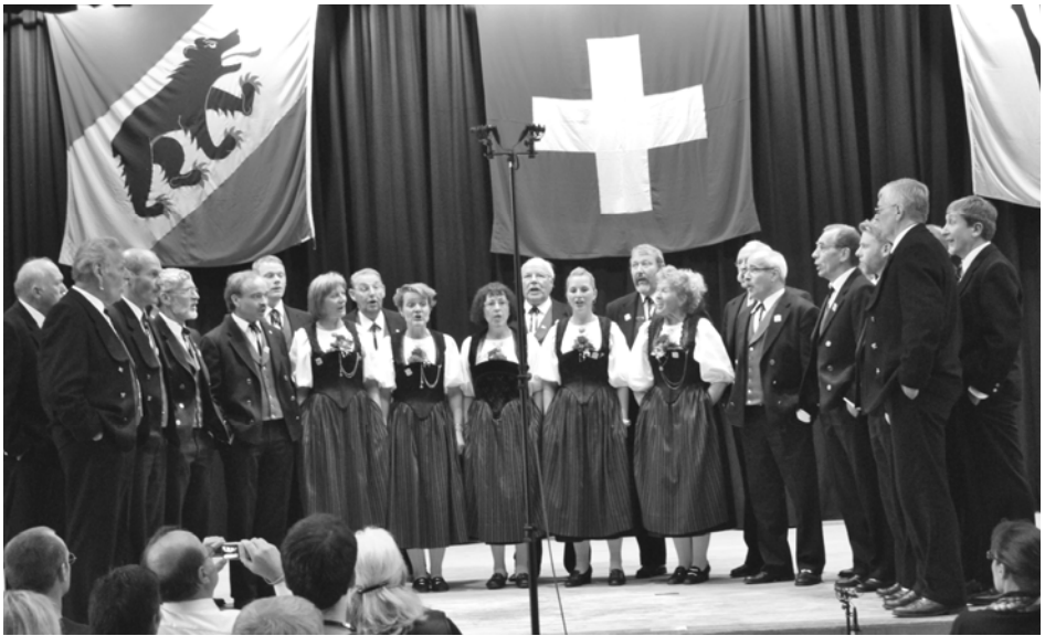
Auftritt beim „Eidgenössischen“ in Interlaken 2011

Das Alphorn gehört aufgrund seiner Anblastetechnik instrumentenkundlich zu den Aerophonen (wie alle Blechblasinstrumente) und wird traditionell überwiegend aus Holz gefertigt. Es besitzt weder Klappen, Züge noch Ventile und ist daher bezüglich der zu spielenden Töne auf die Naturtonreihe beschränkt. Ein Alphorn kann man, je nach Landschaft, 5 bis 10 km weit hören.